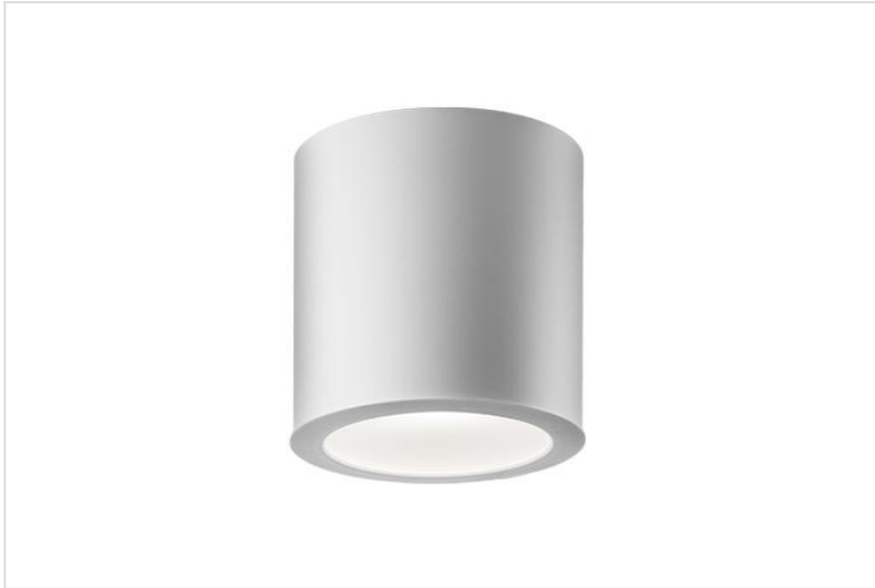
Ravo opbouw versie 2022

Ronde aluminium opbouw behuizing voorzien van LED-downlighter van polycarbonaat met passief aluminium koelelement. Pendelmontage mogelijk (een pendelset is afzonderlijk te bestellen). Voorzien van heldere afscherming of opaal diffuser.