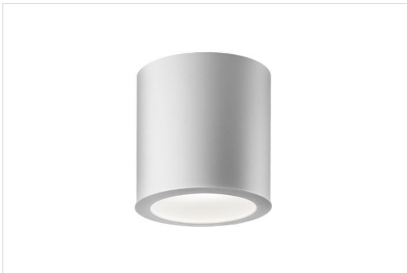
Ravo opbouw versie 2022

Ronde aluminium opbouw behuizing voorzien van LED-downlighter van polycarbonaat met passief aluminium koelelement. Pendelmontage mogelijk (een pendelset is afzonderlijk te bestellen). Voorzien van heldere afscherming of opaal diffuser.